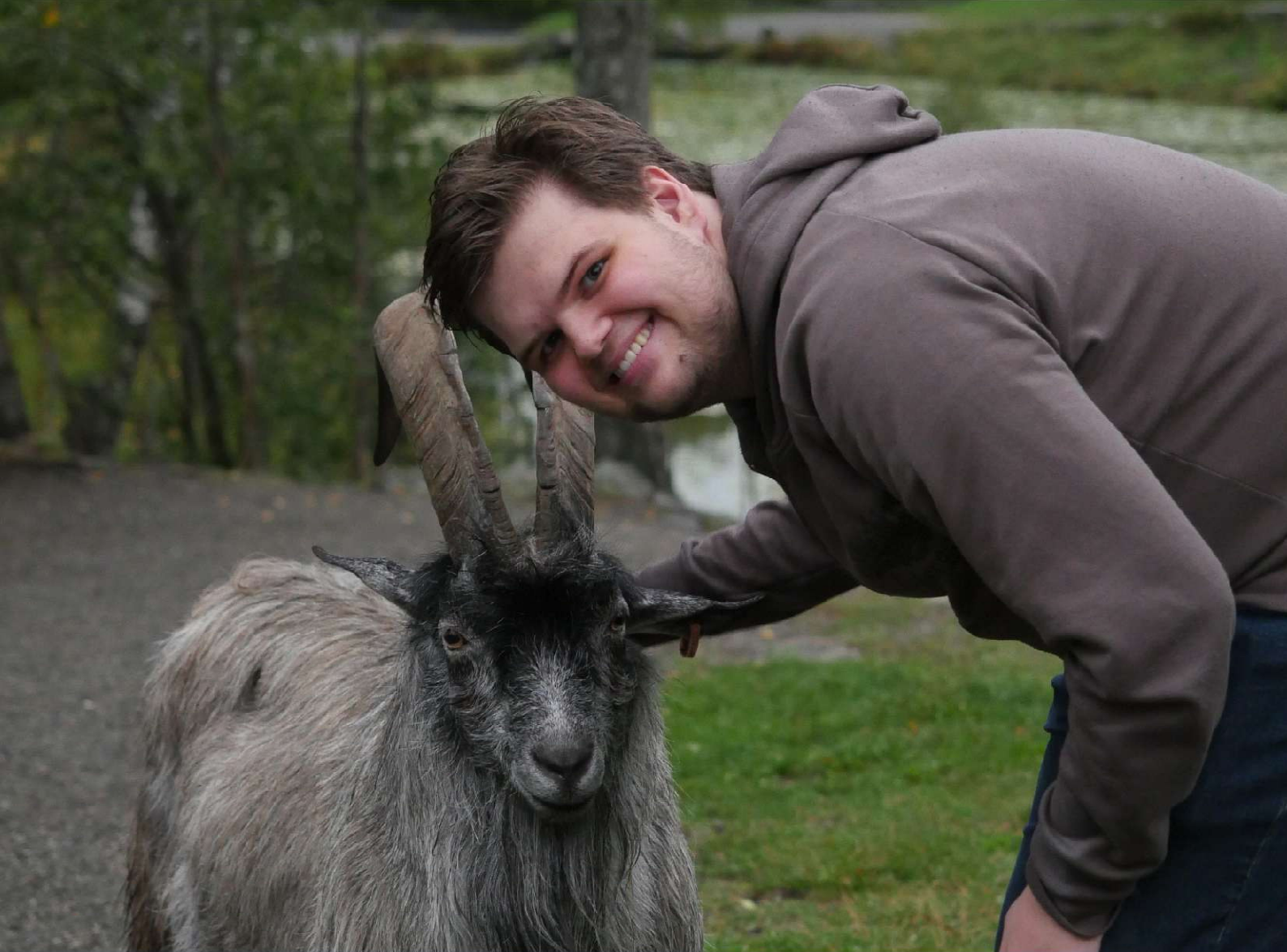
Kveldstur til Maihaugen utendørsmuseum i åpningsuka