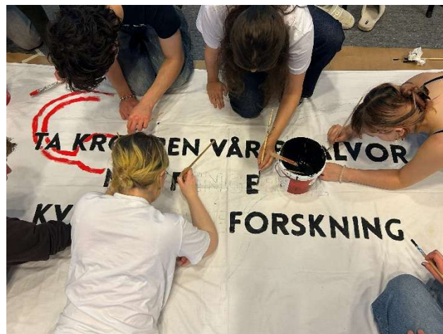
Bannerverksted på 8. mars