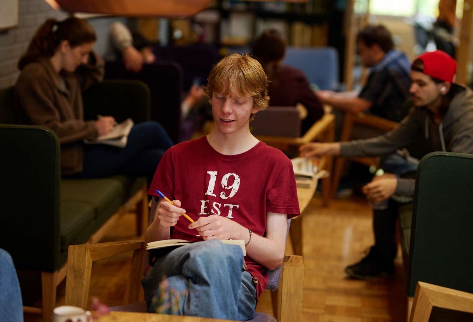
Gruppearbeid i peisestua med Filosofi og politikk-linjen