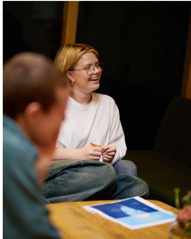
Gruppearbeid