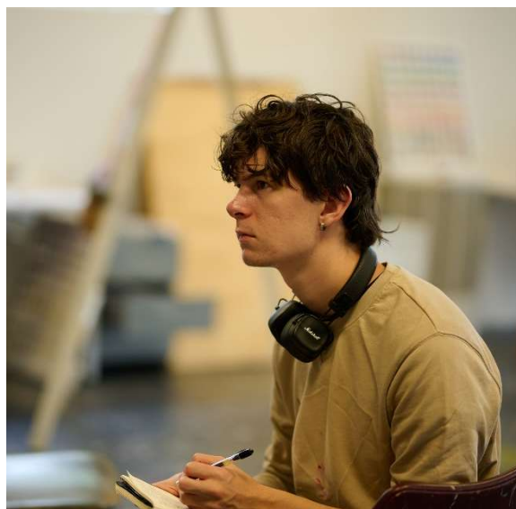
Tegning i atelieret

Valgfaget Billedkunst er ment å gi studentene fra andre linjer enn Visuell kunst mulighet til å lære om kunst og skape ting sammen i forskjellige formuttrykk. Hovedsakelig gikk valgfaget gjennom de samme temaene og teknikkene som Visuell kunst -linjen, men i kortere økter. Studentene har gått gjennom øvelser i tegning, maleri, grafikk, kunst i offentlig rom og komposisjon, laget bokeiermerker og diskutert sammen i grupper, for å nevne noe. Valgfaget har vært en fin avslutning på uka, i siste økt på fredagene.