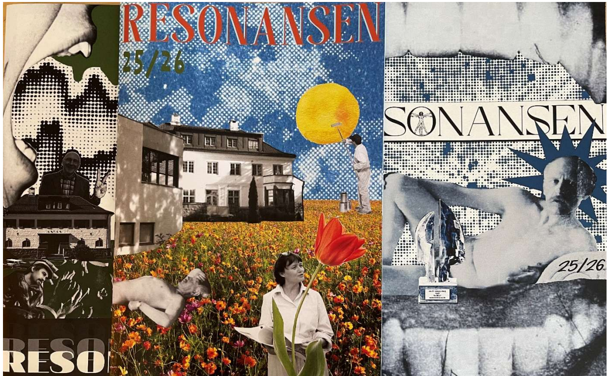
Noen av forsidene på skoleavisa Resonansen