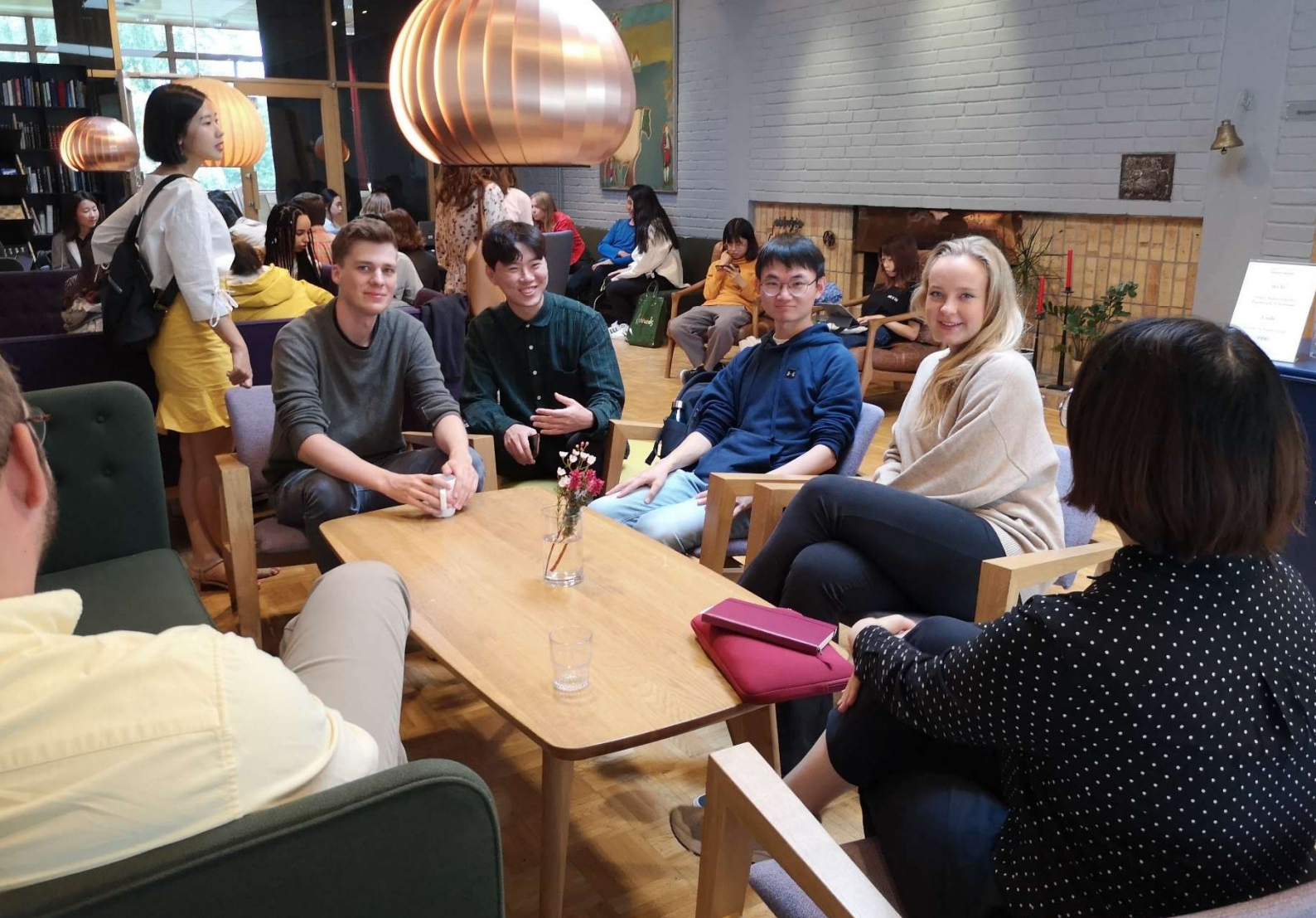
I august blir det igjen NEWDAY – Nansen East-West Dialogue Academy