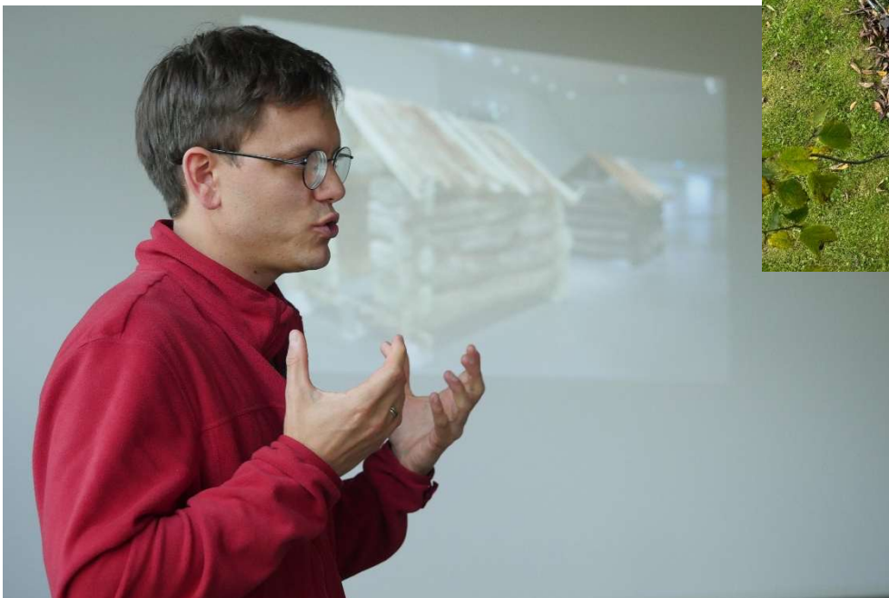
Over: I atelieret