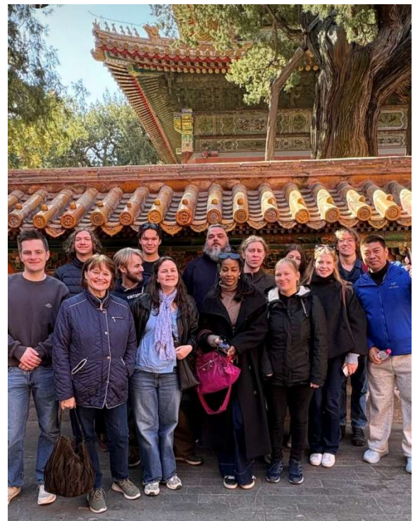
Internasjonal politikk-gjengen i Kina

For de få som ikke reiste utenlands, var det et eget program i Lillehammer med fottur til Lågendeltaet, skidag i Hafjell, kinobesøk med filmen Affeksjonsverdi , restaurantbesøk og isbading fra Badstuferga.