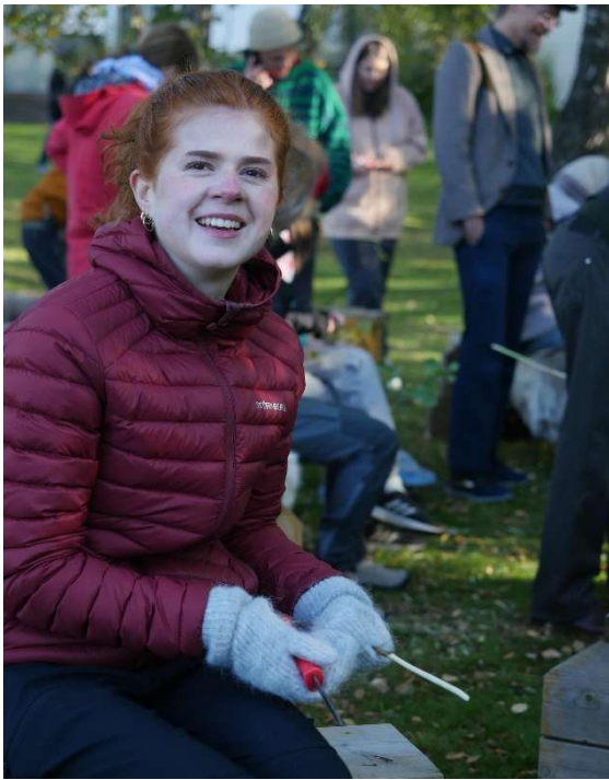
Økouka - Grønne grep - utedag