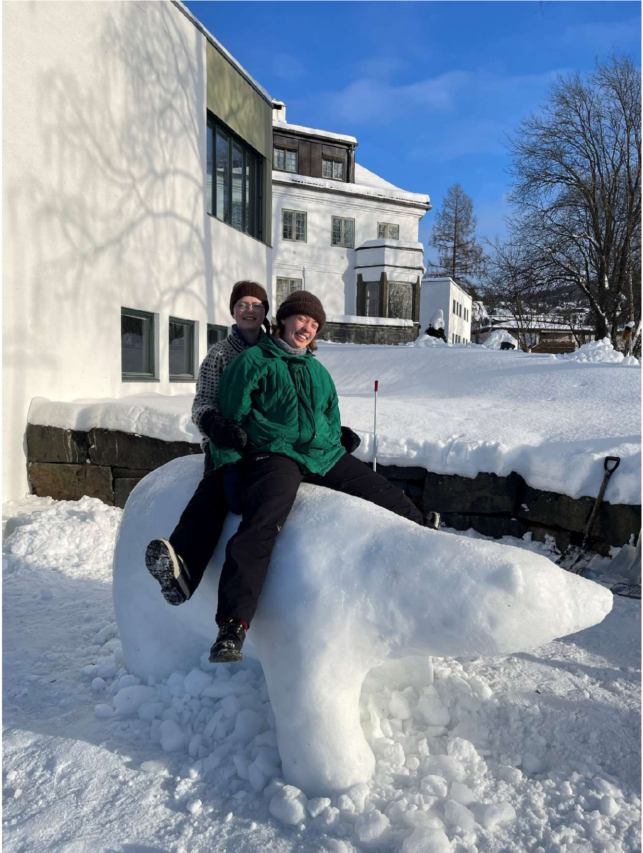
Isbjørnritt - laget av studentene under Vinterdagene i februar 2026