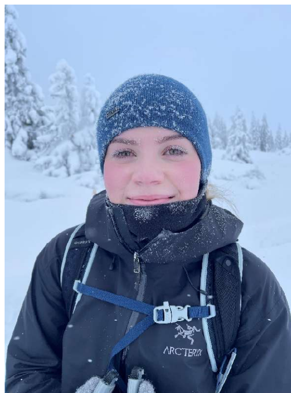
Skitur på Nordseter