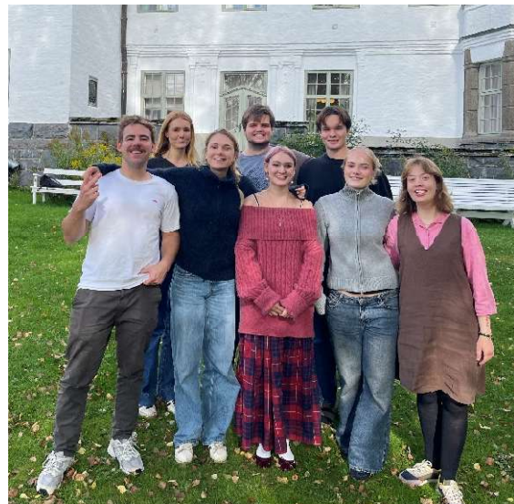
Studentrådet 2025-26