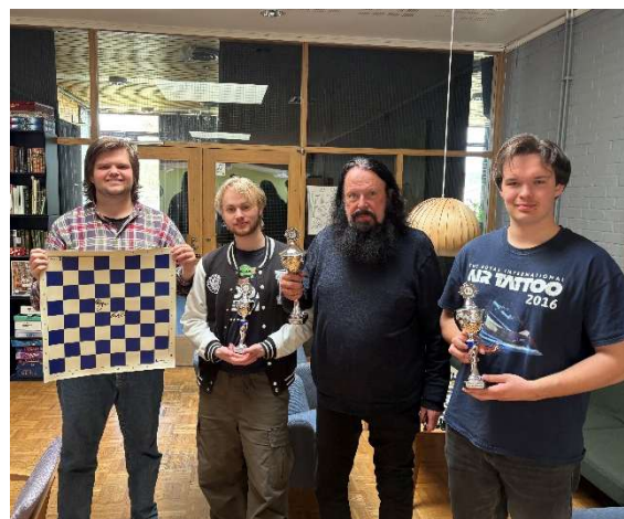
Vinnerne av årets sjakkturnering og av en sjakkmatte signert Magnus Carlsen