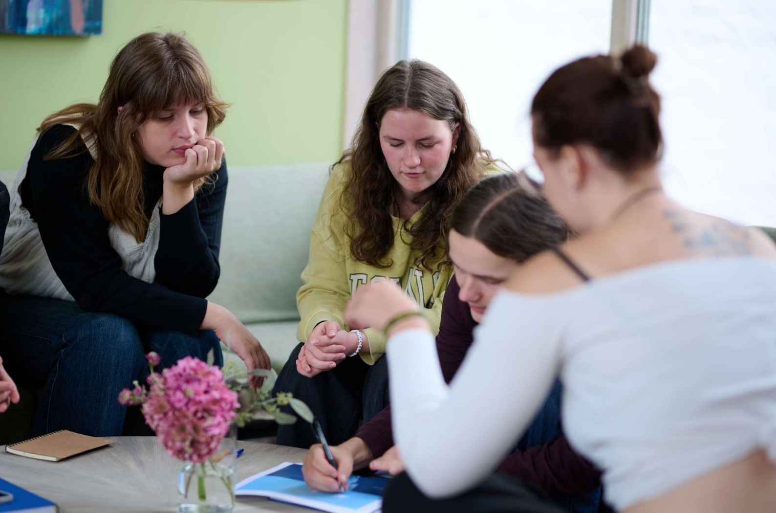
Fellesundervisning, gruppearbeid