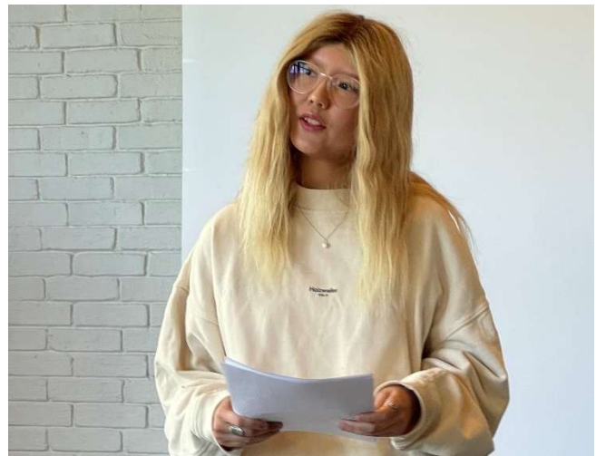
Lesning av egne dikt i plenum