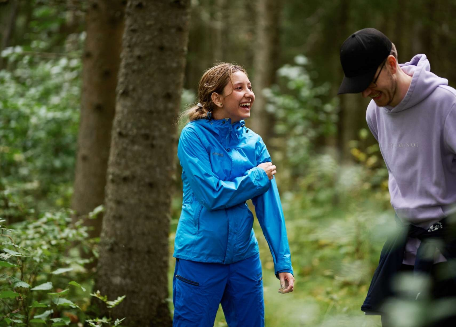
Valgfaget Grønne grep på skogstur