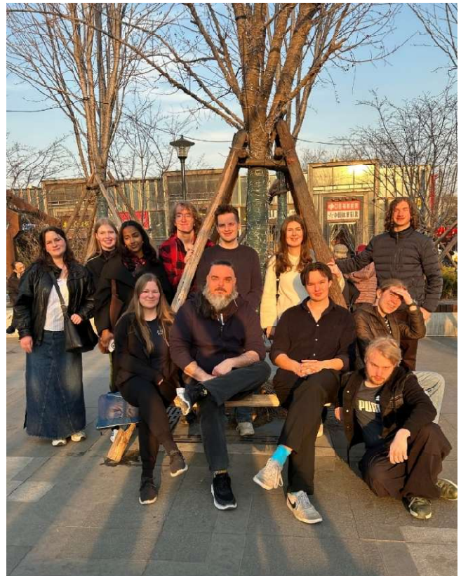
Internasjonal politikk-linjen på tur i Kina