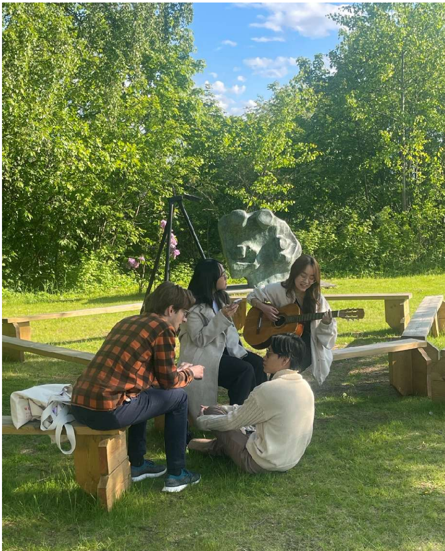
Hyggestund i hagen under dialogkurset More Young Voices

- Leder for Norsk Poesifestival, som gikk av stabelen i mars 2026.