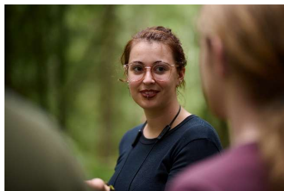
I skogen - naturen var i fokus i to valgfag

Dette valgfaget har en praktisk tilnærming til miljø og bærekraft. Vi startet opp med ulike sanseøvelser ute i skogen, der betydningen av å etablere et forhold til natur er det vesentlige. Hovedhensikten med faget er å bygge økologisk selvtillit, og vise gjennom praktiske aktiviteter hvordan naturen kan brukes, ikke forbrukes. Fagprogrammet besto av praktiske aktiviteter som neverbokslaging, finne spiselige ting i naturen, vri vidjer, soppkurs, lage barkebrød, gjøre opp ild, lage sårssalve og fuglemat, lage kullstifter, sjampo med mer. I den teoretiske delen av faget ble det fokusert på begrepet klimarettferdighet, vannkraft og sivil ulydighet.