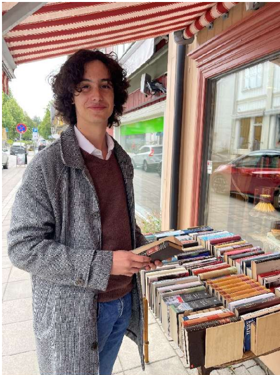
Gode bokkupp i bokhandelen i Storgata

Gjennom året stiftet vi bekjentskap med de fire norske nobelprisvinnerne. Vi besøkte dikterhjemmene, Undsets Bjerkebæk og Bjørnsons Aulestad, og lærte om Knut Hamsun og Jon Fosse.