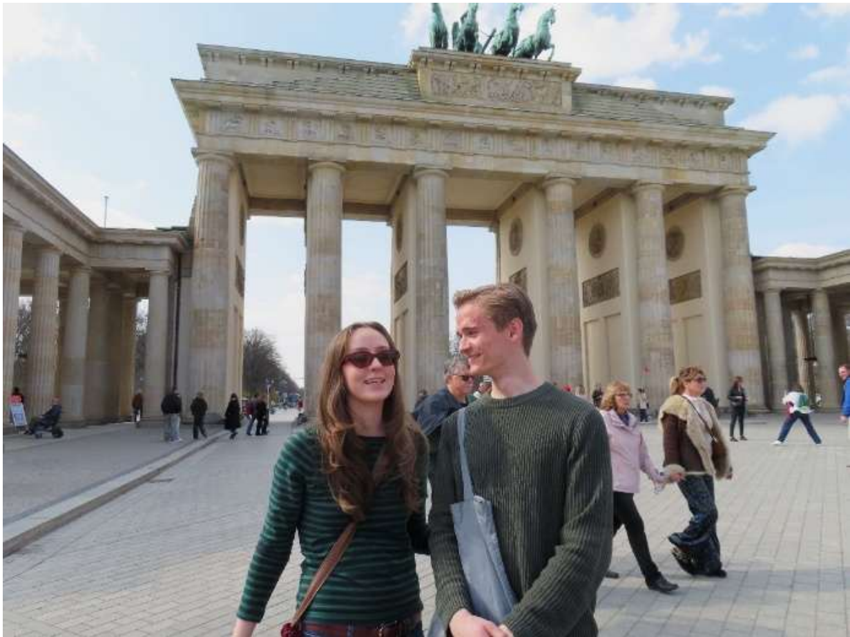
Brandenburger Tor