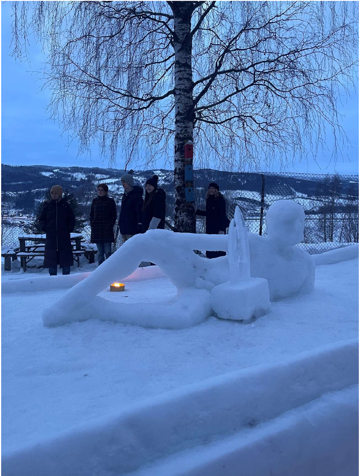
Fridtjof Nansen på Fram med Fritt Ords pris - Vinterdagene