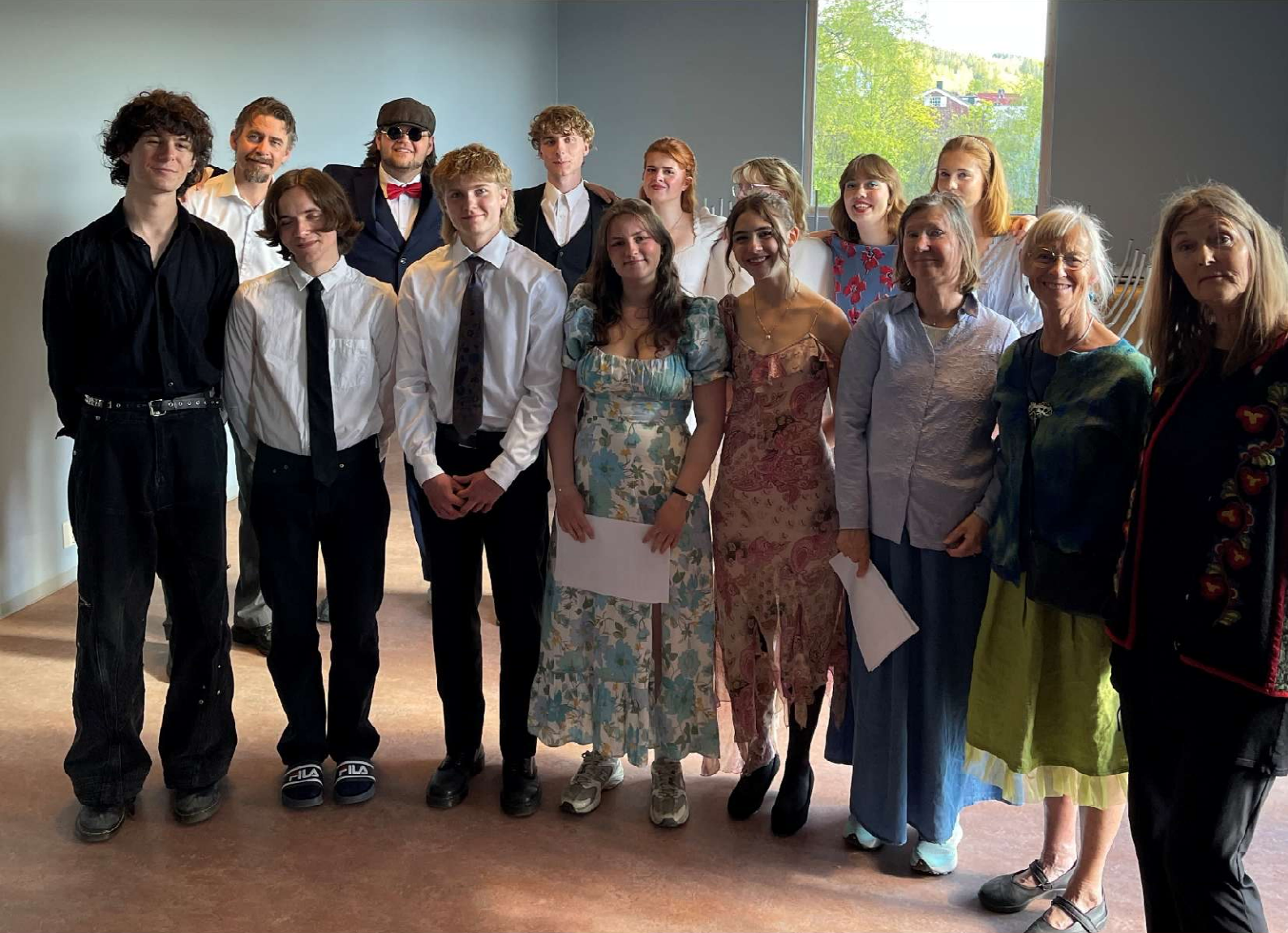
Nansenkoret under generalprøven før sommeravslutningen