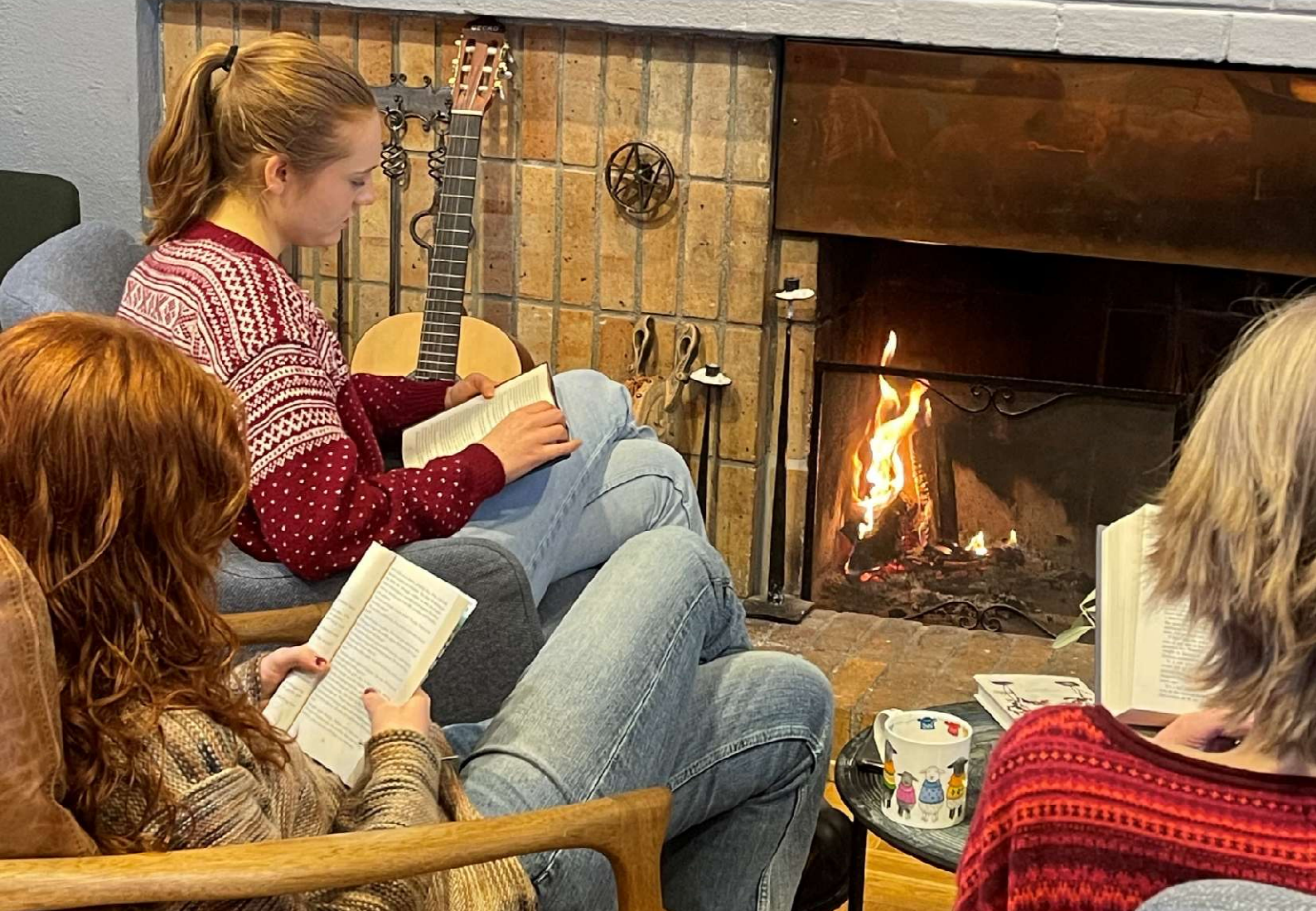
Litteraturstudentene satt ofte og leste sammen i peisestua på kveldstid